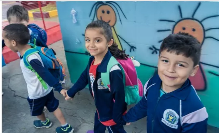
Intituto Educacional Dona Carminha